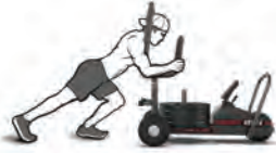
ТОЛКАНИЕ ПЕРЕ-КРЕСТНЫМ ХВАТОМ