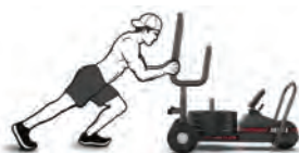
ОБЫЧНОЕ ТОЛКАНИЕ С ВЫСОКИМ ХВАТОМ

Позволяют использовать различные виды хвата для упражнений. Чтобы увеличить нагрузку, установите дополнительные диски.