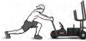
ТОЛКАНИЕ С НИЗКИМ ХВАТОМ